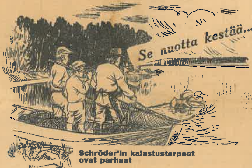
Schröder'in kalastustarpeet ovat parhaat

Kalastustarpeemme ovat palkitut sekä Suomessa että ulkomailla useilla ensipalkinnoilla ja kunniapalkinnoilla.