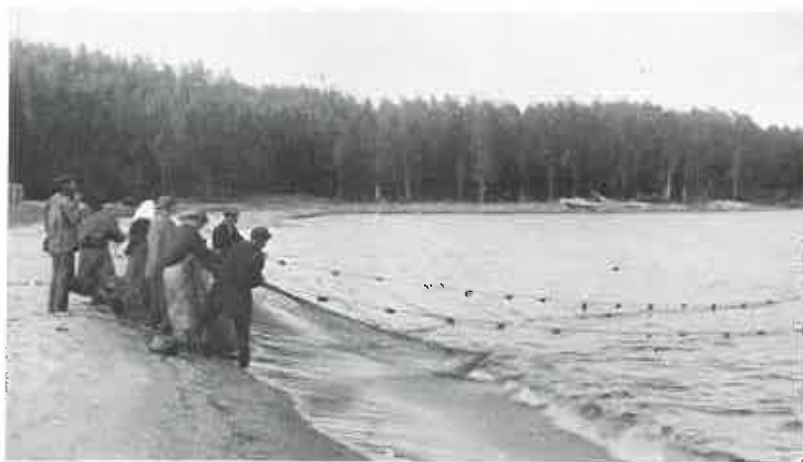
Kuva 2. Pienmuikun pyyntiä nuotalla Pyhäjärven pitäjän Riiskan kylän hieta-pohjaisilta rantavesiltä, elokuulla 1913.

Naaraat: 8.1 sm (5.0, 5.2 g); 8.2 (5.0, 5.3, 5.7, 5.7 g); 8.3 (5.2, 5.3 g); 8.4 (5.7 g); 8.5 (6.2, 6.4 g); 8.6 (6.3, 6.9 g); 8.7 (6.8, 7.2 g); 8.8 (6.2, 7.0 g); 8.9 (7.2, 7.5, 7.6, 7.6, 8.1 g); 9.0 (7.0, 7.1, 7.6, 7.7, 8.0, 8.0 g); 9.1 (8.2, 8.3, 8.4 g); 9.2 (8.2, 8.4, 8.4 g); 9.3 (9.3 g). Yhteensä 35 kpl. Keskipituus 8.74 sm, keskipaino 6.96 g.