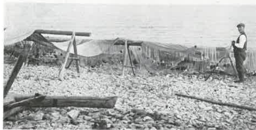
Kuva 1. Laatokan rantaa Pyhäjärven pitäjän Ylläpäässä: verkkoja kuivumassa; heinäkuulla 1915.

Laatokasta saadaan kuten tunnettu muikkuja, jotka koolleen vetävät vertoja siioille. Näitä muikkuja kutsutaan sielläpäin »rääpysiksi». Vv. 1909, 1913 ja 1915 minulla on ollut suurmuikkujakin nähtävänä samoilta seuduilta saatuina kuin pienmuikkuja, siis Lunkulansaaren vesiltä Koillis-Laatokasta ja Käkisalmen ja Pyhäjärven vesiltä Länsi-Laatokalta.