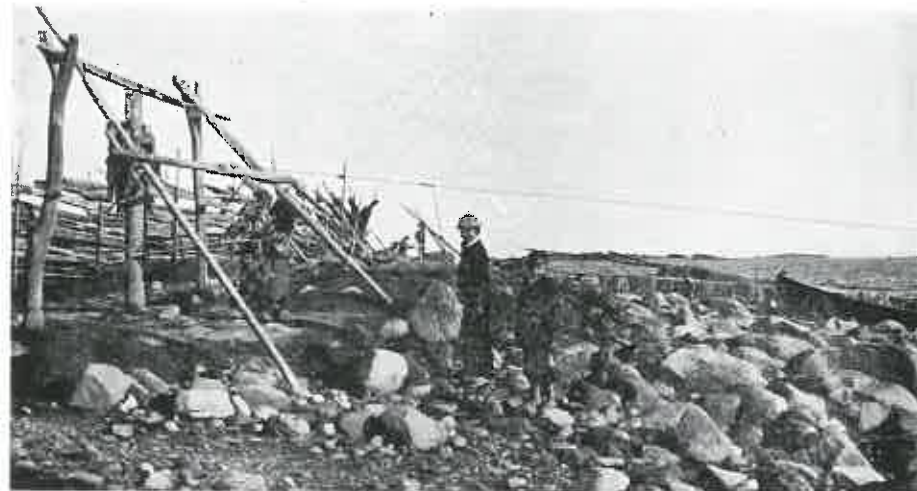
Kuva 1. Pienmuikun pyynnissä käytetyn nuotan vetämistä rantatörmälle pystytettyjen pysyvien kiertimien eli ns. vorotain avulla Lunkulansaaren kivikkorantaa. Valok. heinäk. 1909.

Yksityiskohtaiset tiedot on nähtävissä seuraavasta yhdistelmästä.