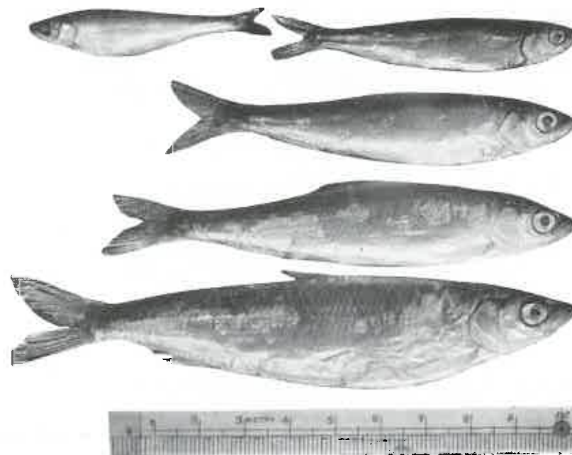
Kuva 3. Laatokan pienmuikkuja, saatu elok. 23. pnä 1913 Pyhäjärven pitäjän Riiskan kylän vesiltä nuotalla. Miltei luonn. koko.

Yläriivi: ensimmäisellä kasvukaudellaan olevia: vasen 5.0 sm pitkä, painolleen 1.2 g, oikea 6.5 sm pitkä, painolleen 2.7 g.