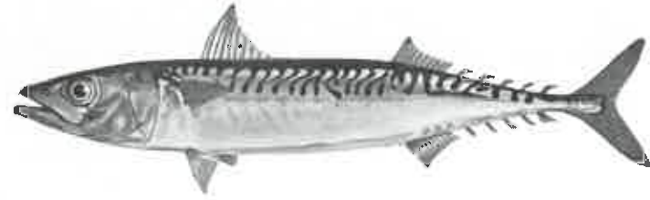
Makrilli ( Scomber scombrus ).

Koska siis syyskesä ja syksy 1936 oli eteläisellä rannikollamme erikoinen makrillikausi, olen laatinut luettelon saapuneista ilmoituksista. Enin osa niistä on lähetetty Suomen Kalastusyhdistyksen ruotsinkielisen aikakauslehdessä toimittajalle kalastusneuvos G. Gottbergille, joka on tiedot julkaissut Fiskeritidskrift för Finland'issa 1936, ss. 165, 187 ja 208; tietoja on myös S. Kalastuslehdessä 1936, ss. 136 ja 196.