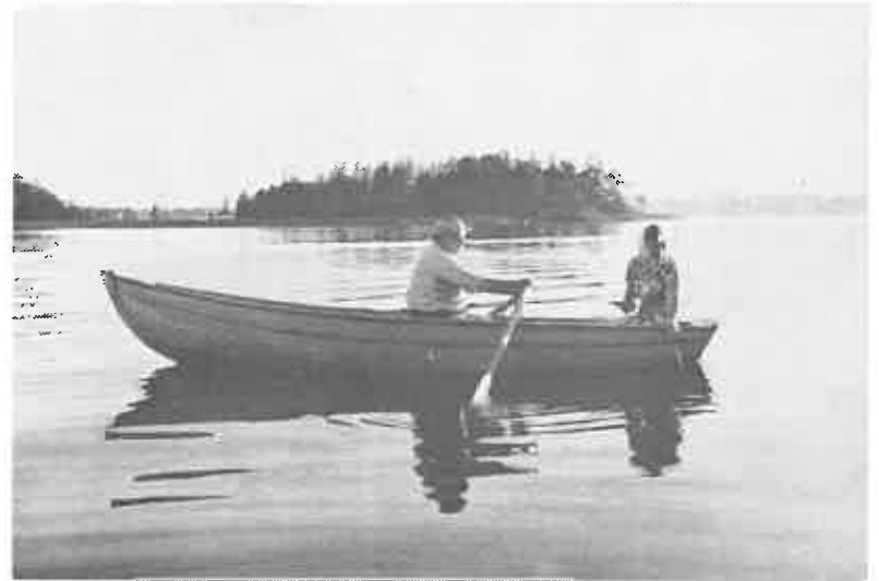
Myös virkistysmahdollisuuksien järjestäminen kuuluu osittain kalastuskuntien tehtäviin

— Kalastuskunta on asianomistaja kalastuskunnan vesialueen luonnon-tilan muutoksia koskevissa vesilain tarkoittamissa vesiasioissa, joiden seurauksena saattaa olla kalataloudellinen vahinko.