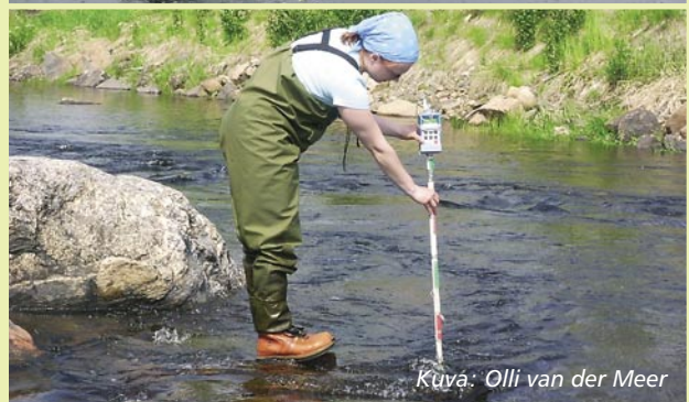
Kuva: Olli van der Meer